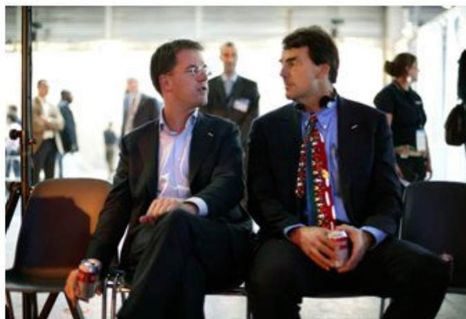
Mark Rutte (ambassadeur BizWorld) in gesprek met Tim Draper tijdens Holland Innovation 4 oktober 2006.

Het bezoek van Tim Draper was er met name op gericht om fondsen te werven voor de stichting BizWorld. De